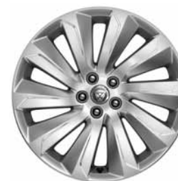
19" 10-SPOKE 'STYLE 1039' SILVER C56J Banden: 235/55 R19