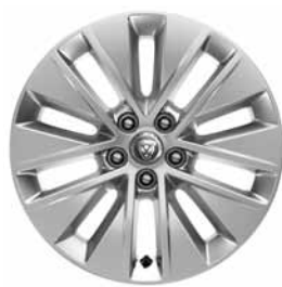
17" 10-SPOKE 'STYLE 1037' SILVER C57E Banden: 235/65 R17