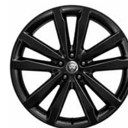
20" 5 BRANCHES DOUBLES 'STYLE 5051' GLOSS BLACK C56N Pneus : 245/45 R20