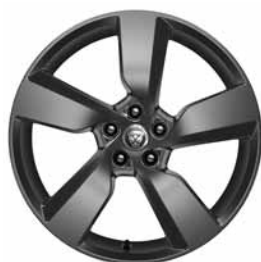
19" 5 BRANCHES 'STYLE 5049' SATIN DARK GREY C69F Pneus : 235/55 R19