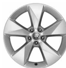
18" 5 BRANCHES 'STYLE 5048' SILVER C56H Pneus : 235/60 R18