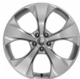
20" 5 BRANCHES 'STYLE 5054' SILVER C57F Pneus : 245/45 R20