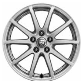
17" 10 BRANCHES 'STYLE 1005' SILVER C56W Pneus : 225/65 R17