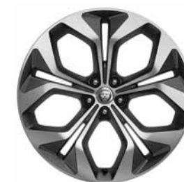
21" 5 BRANCHES DOUBLES 'STYLE 5053' SATIN GREY & DIAMOND TURNED FINISH C56S Pneus : 245/45 R21