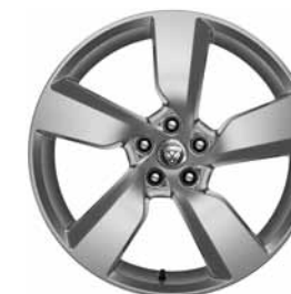
19" 5 BRANCHES 'STYLE 5049' SILVER C56K Pneus : 235/55 R19