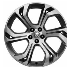
20" 5 BRANCHES DOUBLES 'STYLE 6014' SATIN GREY & DIAMOND TURNED FINISH C56Q Pneus : 245/45 R20