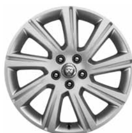
18" 9 BRANCHES 'STYLE 9008' SILVER C56G Pneus : 235/60 R18