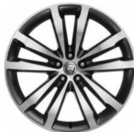
20" 5 BRANCHES DOUBLES 'STYLE 5051' SATIN GREY & DIAMOND TURNED FINISH C56P Pneus : 245/45 R20