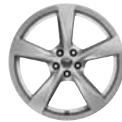
20" 5-Spoke 'Style 5060' Silver 031FL