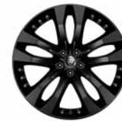
20" 5-Split Spoke 'Style 5039' Gloss Black 029ZL