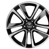
19" 5-Split Spoke 'Style 5058' Technical Grey & Diamond Turned Finish 029ZA