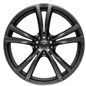
20" 5-Split Spoke 'Style 5061' Satin Grey 031JT