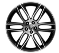
20" 6-Split Spoke 'Style 6003' Dark Grey & Diamond Turned Finish 029ZI