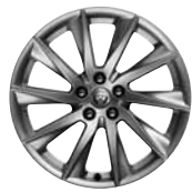
18" 10-Spoke 'Style 1024' Silver 029ZG