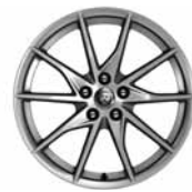
18" 10-Spoke 'Style 1036' Silver 031FK