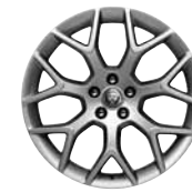
19" 7-Split Spoke 'Style 7013' Silver 029ZK