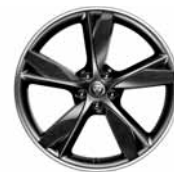
20" 5-Spoke 'Style 5042' Carbon Fibre, Satin Grey & Diamond Turned Finish 029ZS