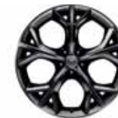
20" 5-Split Spoke 'Style 5040' Metallic Black 031FN