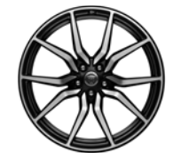
20" 10-Spoke 'Style 1041' Gesmeed, Satin Black & Diamond Turned Finish 031JR