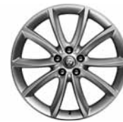
19" 10-Spoke 'Style 1023' Silver 029ZF