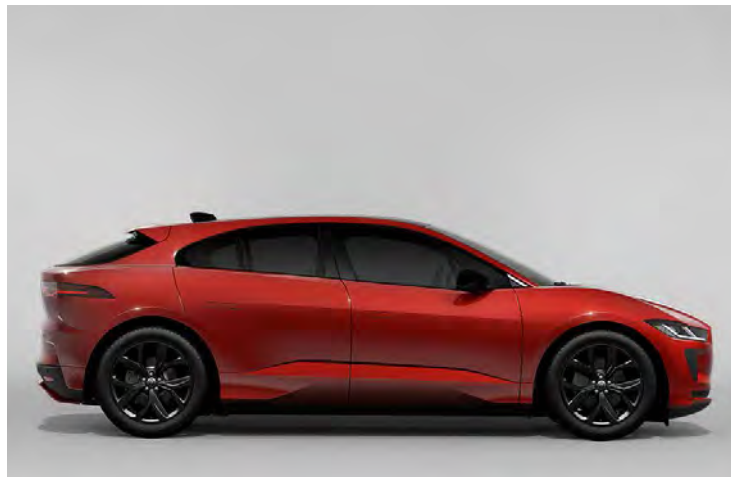
20" 'STYLE 5068' GLOSS BLACK