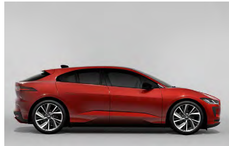
22" 'STYLE 5056' DIAMOND TURNED FINISH & CONTRAST GLOSS DARK GREY