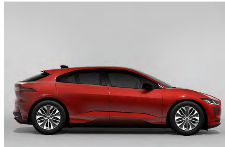
19" 'STYLE 5055' DIAMOND TURNED FINISH & CONTRAST GLOSS DARK GREY